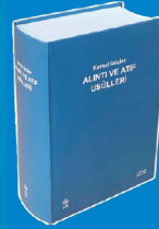
Kemal Gözler, Alıntı ve Atıf Usûlleri , Bursa, Ekin, 2023, 48+1662 s.

TÜHAS, Alıntı ve Atıf Usûlleri başlıklı kitabımızdaki kuralların derlenmesiyle oluşturulmuştur.